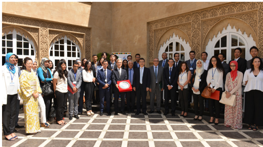
Le Japon ouvre à travers ce programme les portes de ses universités et ses entreprises aux jeunes marocains.

Il est à noter que jusqu'à ce jour, 160 étudiants marocains sont partis poursuivre leurs études au Japon dans le cadre de programmes de bourses. «Les anciens boursiers occupent actuellement des postes importants que ce soit au niveau de la fonction publique que du secteur privé, au Maroc, en Europe et au Japon même», explique Tsuno Kurokawa, ambassadeur du Japon au Maroc, dans ce sens. «ABE Initiative a pour objectif de former 1.000 jeunes africains. C'est un nouveau jalon dynamisant la coopération dans le domaine de l'éducation», a